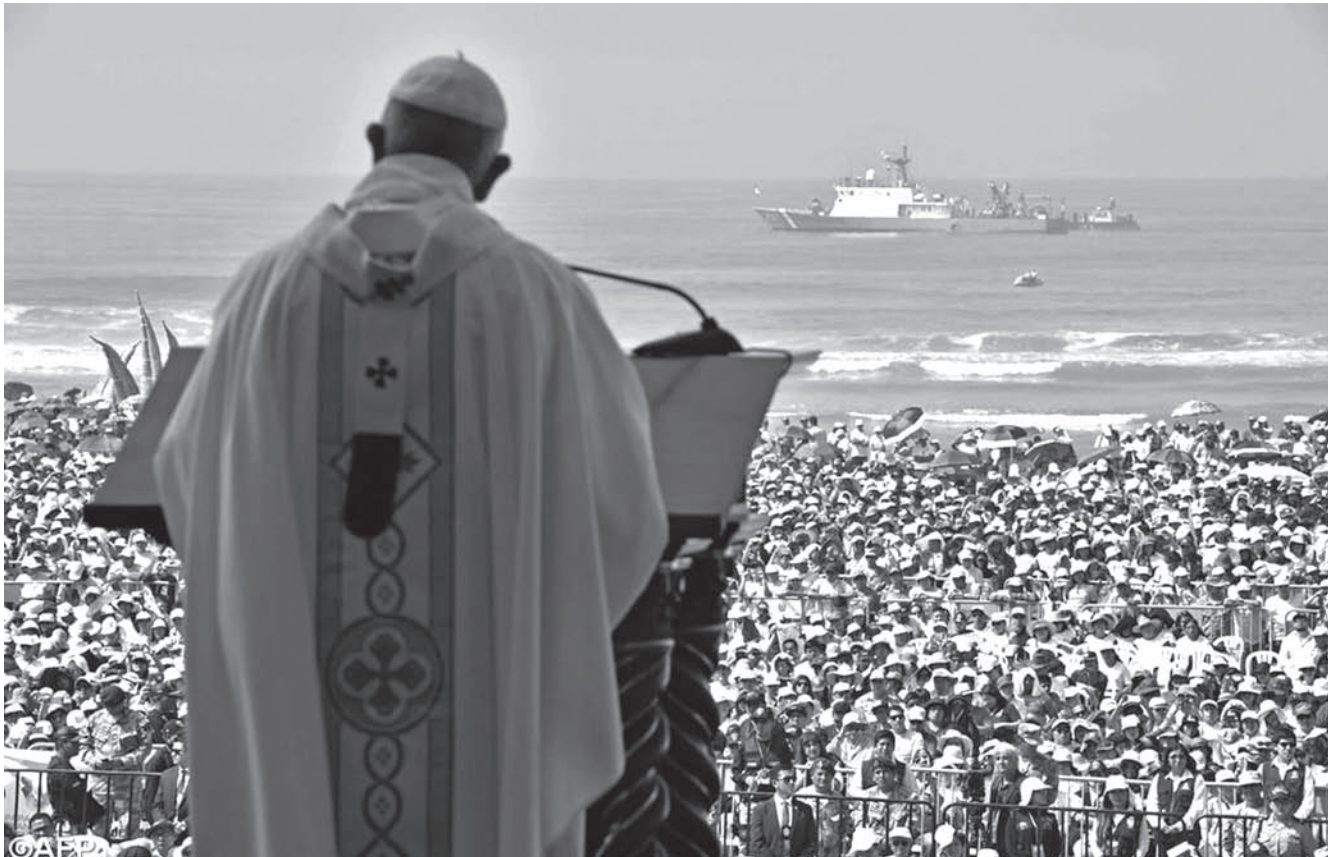
El Sumo Pontífice en la celebración de la misa en la playa Huanchaco, Trujillo.