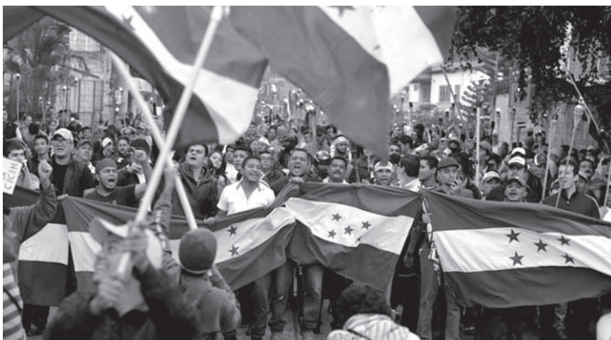
Protestas tras reelección presidencial considerada ilegítima a favor de Juan Orlando Hernández.

presidencial y prohíben al ciudadano que ya desempeño el cargo de presidente volver a serlo. Estos artículos constitucionales que no se pueden reformar son conocidos como “Artículos pétreos”.