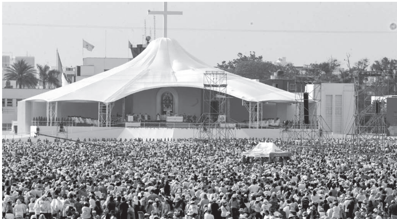
Misa celebrada en la base aérea Las Palmas, en Lima.

Jamás olvidará aquel día, cuando fue parte de los casi dos millones de peregrinos, que llegaron a escuchar la misa multitudinaria del Santo Padre.