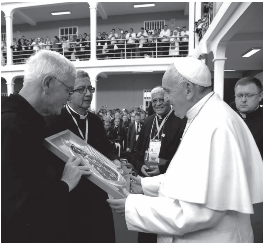
Padre Juan José Lydon entrega imagen de la Virgen de la Puerta al Papa Francisco.

pecado, de la tristeza, del vacío interior, del aislamiento. Con Jesucristo siempre nace y renace la alegría» [3]. Y ésta es contagiosa.