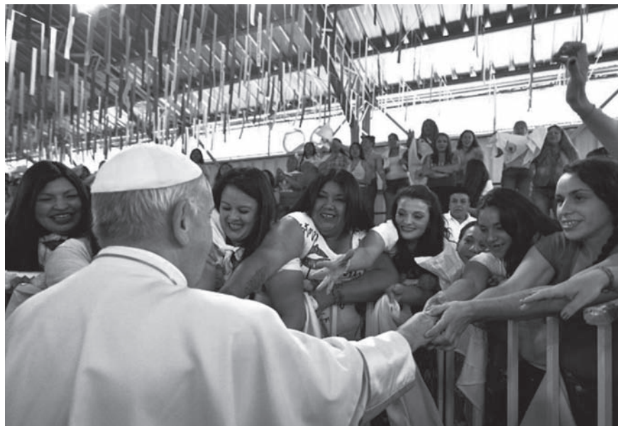
El Papa Francisco en visita el centro penitenciario femenino de San Joaquín, en Santiago de Chile.

te a la Nunciatura donde se alojó el Papa. Allí se usaron las antiguas vallas, que habían debutado durante la visita de Juan Pablo II: de un metro de alto, que contienen, pero no separan. Francisco bajó allí del papamovil y saludó a muchas personas. El Papa no podía saber del escenario que se le había preparado.