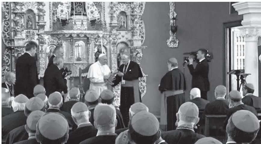
Monseñor Salvador Pineiro entrega presente al Papa en el Palacio Arzobispal de Lima.

una estola; todos pintados, con sus trajes: eran diáconos permanentes. Anímense, anímense, así lo hacía Toribio. En aquella época no había diáconos permanentes, había catequistas, pero en su lengua, en su cultura, y ahí se metió. Me conmovió ver a esos diáconos permanentes.