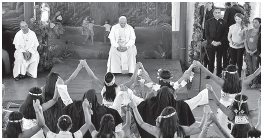
Encuentro con los niños y niñas del albergue infantil “El Principito”.

¡Qué testimonio tan bueno el de ustedes jóvenes que han transitado por este camino, que ayer se llenaron de amor en esta casa y hoy han podido formar su propio futuro! Ustedes son para todos nosotros la señal de las inmensas potencialidades que tiene cada persona. Para estos niños y niñas ustedes son el mejor ejemplo a seguir, la esperanza de que ellos también podrán. Todos necesitamos modelos a seguir; los niños necesitan mirar para adelante y encontrar modelos positivos: «Quiero ser como él, quiero ser como ella», sienten y dicen. Todo lo que ustedes jóvenes puedan hacer, como venir a estar con ellos, a jugar, a pasar el tiempo es importante. Sean para ellos, como decía el Principito, las estrellitas que iluminan en la noche . [1]