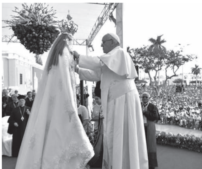
El Papa Francisco en coronación a la Virgen de la Puerta de Otuzco.

Cada comunidad, cada rincón de este suelo viene acompañado por el rostro de un santo, el amor a Jesucristo y a su Madre. Y contemplar que donde haya una comunidad, donde haya vida y corazones latiendo y ansiosos por encontrar motivos para la esperanza, para el canto, para el baile, para una vida digna... ahí está el Señor, ahí encontramos a su Madre y también el ejemplo de tantos santos que nos ayudan a permanecer alegres