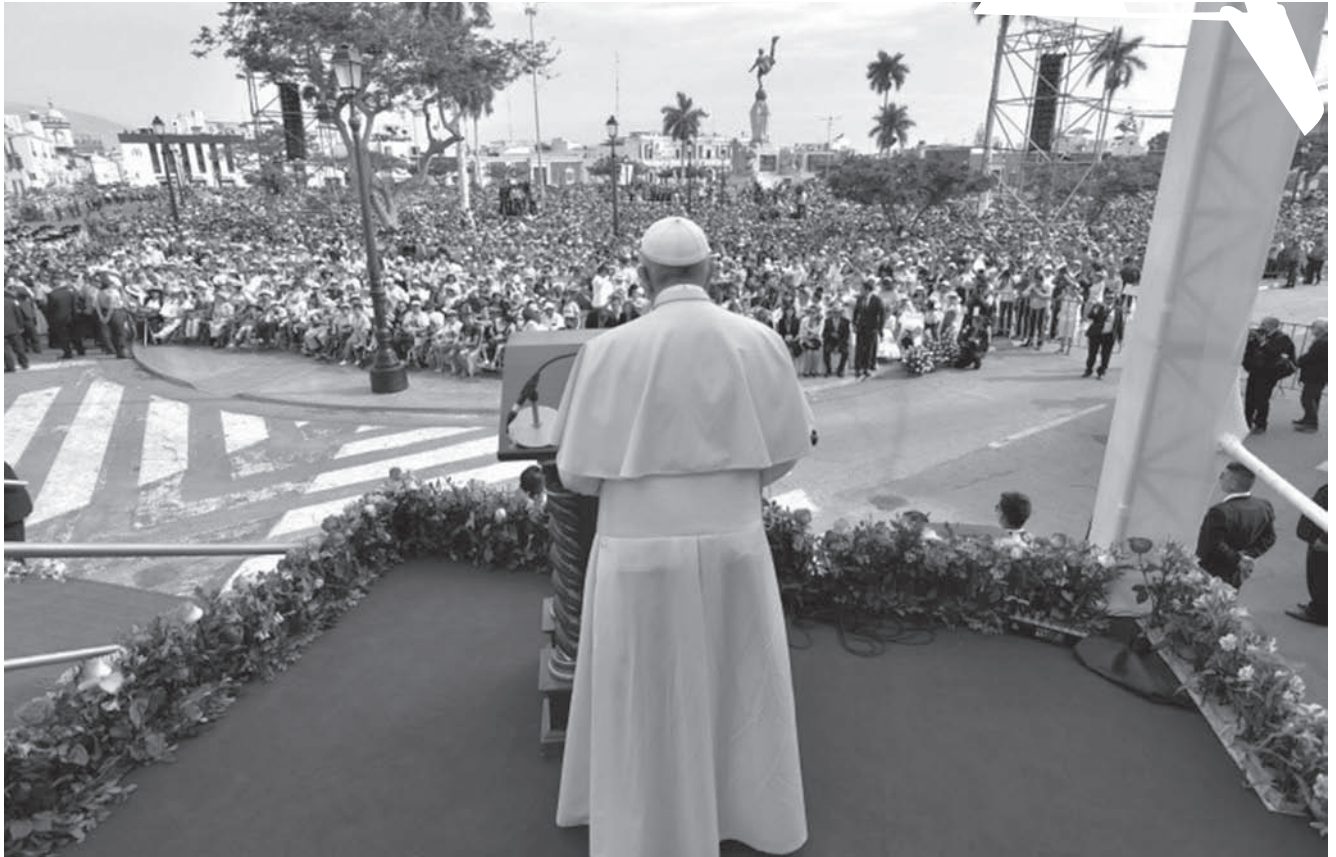
El Santo Padre en la plaza de armas de Trujillo.

mundo, en medio de borrascas y de tempestades: mira la Estrella e invoca a María». [2] Ella nos indica el camino a casa, ella nos lleva a Jesús que es la Puerta de la Misericordia, y nos deja con Él, no quiere nada para sí, nos lleva a Jesús.