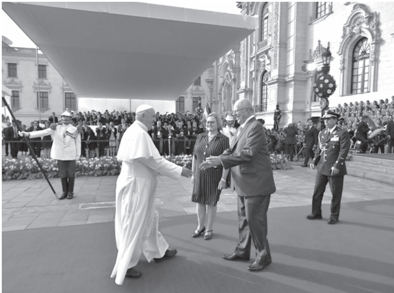
El Papa Francisco es recibido en Palacio de Gobierno por el ex presidente Pedro Pablo Kuczynski en Lima.

comunidades. No podemos pensarlas como dos instancias distintas.