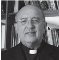
*MONS. PEDRO RICARDO BARRETO JIMENO S.J.

L a Amazonía (7.5 millones Km 2 ) es el hogar de 33 millones de personas (de ellos 3 millones de indígenas) que están bajo amenaza de los efectos devastadores del cambio climático, la polución ambiental en sus diferentes formas, la deforestación (pérdida de su hábitat) y la explotación inconsiderada de sus recursos naturales. “El 17% de la selva ha desaparecido y la tasa de extinción de especies llega a ser mil veces superior a la histórica” (Cfr. IUCN, Global Biodiversity, Outlook 3, Montreal – Canadá - 2010). Sin embargo debemos sentir y hacer nuestros los gritos de la tierra y de nuestros hermanos indígenas por las graves consecuencias de una sociedad tecnócrata y extractiva que afectan la calidad de vida de los pueblos amazónicos.