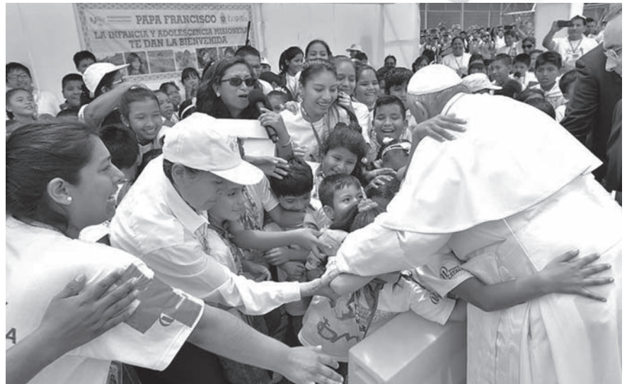
Recibimiento al Santo Padre por la infancia y adolescencia misionera en el aeropuerto internacional Padre Aldamiz Puerto Maldonado.

Ustedes tienen en María, no sólo un testimonio a quien mirar, sino una Madre y donde hay madre no está ese mal terrible de sentir que no le pertenecemos a nadie, ese sentimiento que nace cuando comienza a desaparecer la certeza de que pertenecemos a una familia, a un pueblo, a una tierra, a nuestro Dios. Queridos hermanos, lo primero que me gustaría transmitir-