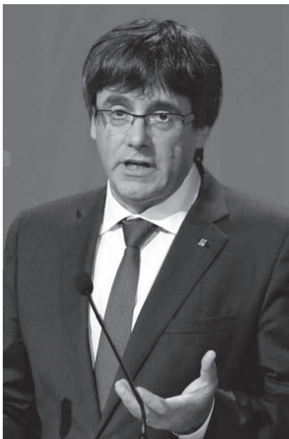
Carles Puigdemont, ex presidente de la Generalitat.

dentistas; pero tiene el inconveniente de que está fugado o exiliado (según la jerga de los bandos enfrentados), en Bruselas, pero con el inconveniente de que sería inmediatamente detenido si pisara suelo español, ya que está judicialmente reclamado por diversos delitos, con lo que sería puesto a disposición judicial, lo cual impediría el normal desarrollo del debate de investidura y el posterior ejercicio del poder propio de la presidencia; o sea, en la práctica parece estar inhabilitado para gobernar. Y ahí reside el conflicto en el que se encuentran empantanados los independentistas y el país entero. Unos reivindican la legitimidad del Presidente depuesto, para ocupar además de nuevo el cargo; los otros, en la perspectiva realista, aduciendo que no puede gobernarse un país desde el extranjero salvando la distancia con streaming, el plasma, el teléfono, o artilugios parecidos. Y eso aparte de la dificultad inicial de conseguir realizar un debate de investidura normal, o sea, con comparecencia, presentación del programa y debate consiguiente con los grupos parlamentarios. Y aquí está encallada la cuestión. Los legitimistas creen que no deben ceder en su derecho a la reelección. Sería como una deserción ante las malas artes del gobierno español. Los realistas invo-