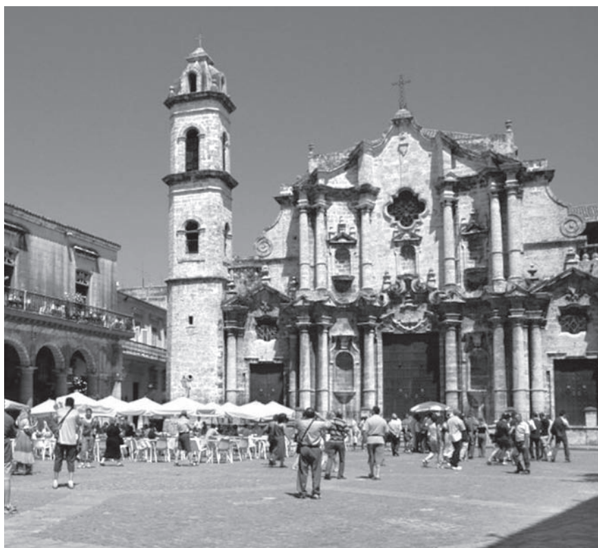
Arquiidiócesis de San Cristóbal de la Habana.

Conocí con especial asombro la redacción de las revistas Palabra Nueva y Espacio Laical, órganos de la arquidiócesis de la Habana que por años promueven la cultura cristiana y ocupan hoy un espacio obligado de lectura en círculos eclesiales, y aún más allá de estos. También visitamos el Centro Loyola de los jesuitas, para interesarnos por la hojita dominical Vida Cristiana, que con un altísimo tiraje se mantiene vigente –aún contra la corriente–, en todas las parroquias del país por casi sesenta años.