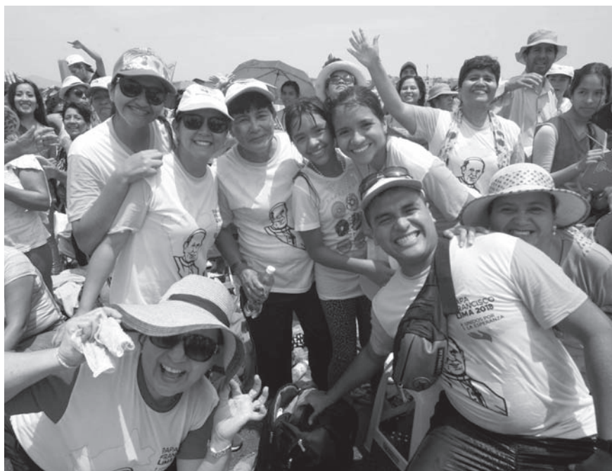
Jóvenes entusiastas en la misa celebrada en la base aérea “Las Palmas” en Lima.

Cabe resaltar la gran acogida del Pontífice por la juventud, quienes desde diferentes tribunas a nivel nacional se sumaron a la llamada “Guardia del Papa”, logrando reunirse aproximadamente treinta y cinco mil voluntarios, una cifra verdaderamente impresionante. En este espacio no solo se les capacitó para la tarea que realizaron, sino hubo una importante labor de formación espiritual.