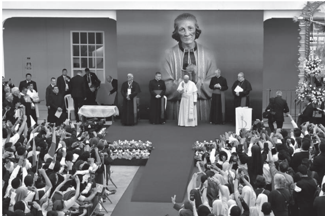
El Sumo Pontífice reunido con religiosos, sacerdotes y seminaristas en el Colegio Seminario San Carlos y San Marcelo en Trujillo.

el Señor, codo a codo, pero sin olvidarnos nunca de que no ocupamos su lugar. Y esto no nos hace «aflojar» en la tarea evangelizadora, por el contrario, nos empuja, nos exige trabajar recordando que somos discípulos del único Maestro. El discípulo sabe que secunda y siempre secundará al Maestro. Y esa es la fuente de nuestra alegría, la alegre conciencia de sí mismo.