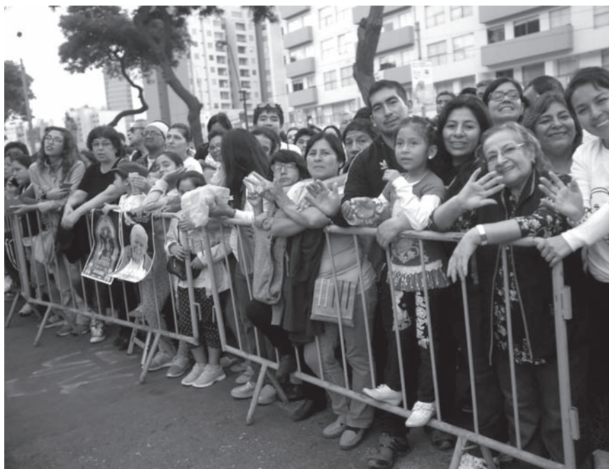
Peruanos a la espera del Papa en las afueras de la Nunciatura Apostólica.

El Vicario de Cristo, nos invita a dejar de lado el resentimiento, la violencia y la venganza para vivir como