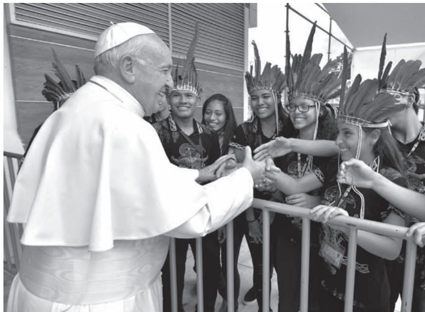
El Papa en su visita a Puerto Maldonado.

La Iglesia necesita ayudar a los pueblos originarios a visibilizar su existencia como personas y comunidades con su problemática socio ambiental. Nos ha hecho conscientes que los países amazónicos, entre ellos, el Perú, hemos vivido y vivimos aún “de espaldas” a la Amazonía y a los pueblos que habitan en ella. En alguna oportunidad tal vez hemos escuchado decir, de manera despectiva, que está habitada por “salvajes” y que son “ciudadanos de segunda categoría”. Somos ignorantes de la riqueza de las culturas ancestrales amazónicas que viven en armonía con su entorno natural y de la gran biodiversidad de la Amazonía.