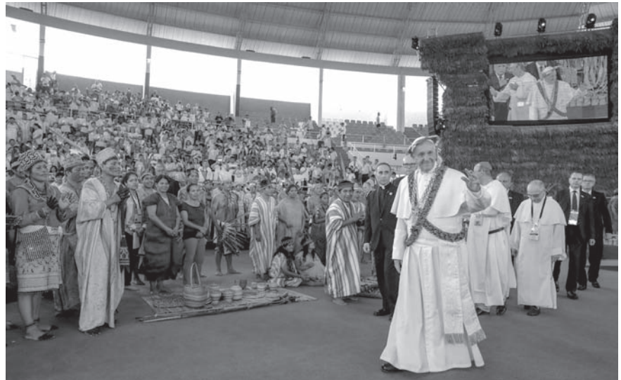
El Papa Francisco en el Coliseo Madre de Dios.

Paralelamente, existe otra devastación de la vida que viene acarreada con esta contaminación ambiental propiciada por la minería ilegal. Me refiero a la trata de personas: la mano de obra esclava o el abuso sexual. La violencia contra las adolescentes y contra las mujeres es un clamor que llega al cielo. «Siempre me angustió la situación de los que son objeto de las diversas formas de trata de personas. Quisiera que se escuchara el grito de Dios preguntándonos a todos: “¿Dónde está tu hermano?” (Gn 4,9). ¿Dónde está tu hermano esclavo? [...] No nos hagamos los distraídos ni miremos para otra parte. Hay mucha complicidad. ¡La pregunta es para todos!» [2].